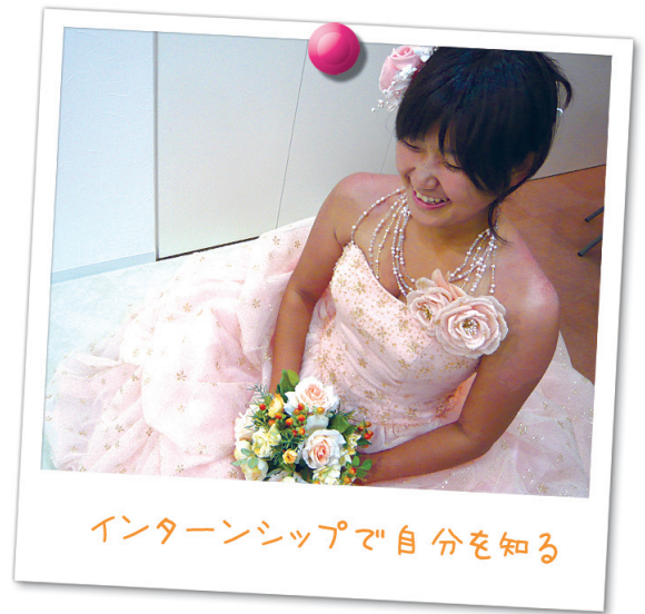
インターンシップで自分を知る